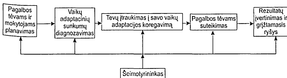
2 pav. Pagalbos tėvams ir mokytojams organizavimo struktūra koreguojant nesavarankiškų pirmos klasės mokinių adaptavimosi sunkumus mokykloje (Burvytė, 2011)

Pirmaklasių adaptavimosi sunkumų pedagoginei korekcijai nėra skiriama pakankamai dėmesio mūsų visuomenėje. Tyrimo rezultatai išryškino išskirtinius šių dienų nesavarankiškų pirmaklasių adaptavimosi sunkumus kasdienėje mokyklos aplinkoje, kuriuos lemia išsiugdyti dominuojantys charakterio bruožai, atskleistos jų koregavimo galimybės suteikiant pagalbą tėvams. Egzistuojančios šių dienų pirmaklasių adaptavimosi problemos iki šiol nėra tinkamai įvertintos, nors jos prognozuoja ateitį. Laikotarpio problemos yra egzistencijos krizė to, kas galėjo būti, bet nebuvo išspręsta. Adaptavimosi problemos kyla tuomet, kai pirmaklasiai ar jų tėvai, susidūrę su nauja aplinka mokykloje, nusprendžia, kad jie neatitinka mokyklos keliamų reikalavimų ar mokykla neatitinka jų reikalavimų. Tokių situacijų daugėja, tad pagalbos poreikis darosi vis aktualesnis. Siekiant padėti tėvams, reikalingi šeimotyrininkai, kurie padėtų tėvams suvokti pagrindinę problemą, atskleisti esamą situaciją visuomenėje ir jos atspindžius kiekvienoje šeimoje, galimas to pasekmes ateityje, padėtų tėvams išskirti konkrečius faktus, susijusius su problema, ir rasti konkrečius sprendimus esamai situacijai spręsti.